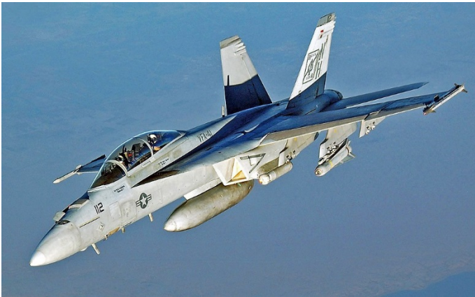
ตัวอย่างภาพ F/A-18E/F Super Hornet

▶ กองทัพเรือสหรัฐอเมริกาปรับปรุงเครื่องบินขับไล่ Super Hornet โดยบริษัท Boeing เป็นผู้ดำเนินการปรับปรุง และได้รับเครื่องบินลำแรกเมื่อช่วงต้นเดือน เม.ย. 61 ณ โรงงานผลิตที่เมืองเซนต์หลุยส์ รัฐมิสซูรี ใช้ระยะเวลา 1 ทศวรรษในการปรับปรุงต่ออายุเครื่องบินขับไล่ F/A-18E/F ของกองทัพเรือสหรัฐฯ จาก 6,000 ชม.บิน เป็น 9,000 ชม.บิน และปรับปรุงเป็น Block III บริษัทมีขีดความสามารถในการปรับปรุงเครื่องบินได้เดือนละ 2 ลำ ทั้งนี้ กองทัพเรือสหรัฐฯ มีแผนจัดหาเครื่องบินขับไล่ Super Hornet Block III จำนวน 110 ลำ มูลค่า 9,200 ล้านดอลลาร์สหรัฐฯ ในช่วงปี 62 – 66 / defense news