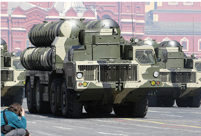
ตัวอย่างภาพ S-300 Family

ตามตารางการฝึกในรัฐแคลิฟอร์เนียทำให้เจ้าหน้าที่ผู้ทำการในอากาศเสียชีวิต 4 คน และในวันถัดมา Thunderbird F-16 ของกองทัพอากาศสหรัฐฯ ตกระหว่างการบินฝึกใกล้ฐานบินเนลีส รัฐเนวาดา นักบิน 1 คน เสียชีวิต กรมการบินทหารสหรัฐฯ อยู่ในภาวะวิกฤตและต้องพยายามแก้ไขปัญหาอย่างเร่งด่วน / defense news