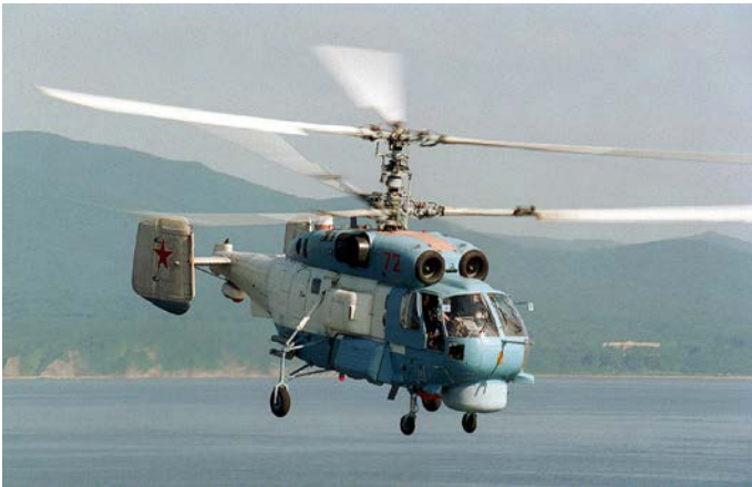
ตัวอย่างภาพ เฮลิคอปเตอร์ Ka-27

กำหนดความพร้อมรบเต็มอัตราในปี 66 / Jane's