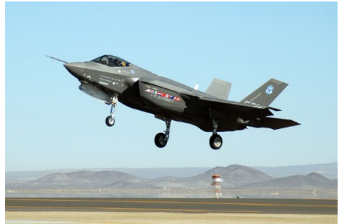
ตัวอย่างภาพ สถานีอวกาศ F-35A Lightning II

▶ จีนซ้อมรบทางทะเลที่ใหญ่ที่สุดในประวัติศาสตร์ของจีน โดยมีประธานาธิบดีจีนเป็นผู้เปิดงานในวันที่ 12 เม.ย. 61 ซ้อมรบในทะเลจีนใต้และบริเวณนอกชายฝั่งไต้หวัน ใช้ทหารเรือกว่า 10,000 คน เครื่องบินขับไล่ 76 ลำ เรือรบและเรือดำน้ำ 48 ลำ โดยนายสี จิ้น ผิง ประกาศว่าจีนต้องการเป็นผู้นำในด้านกองทัพเรือ